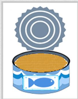
КОНСЕРВЫ-СУПЫ, ПАШТЕТЫ, СУФЛЕ, РЫБОРАСТИТЕЛЬНЫЕ КОНСЕРВЫ