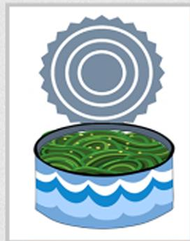
КОНСЕРВЫ ИЗ МОРСКОЙ КАПУСТЫ ТАКЖЕ ОТНОСЯТСЯ К РЫБНЫМ КОНСЕРВАМ