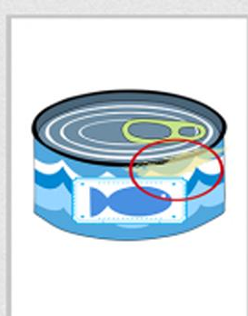
ПОДТЁКИ НА ПОВЕРХНОСТИ БАНКИ